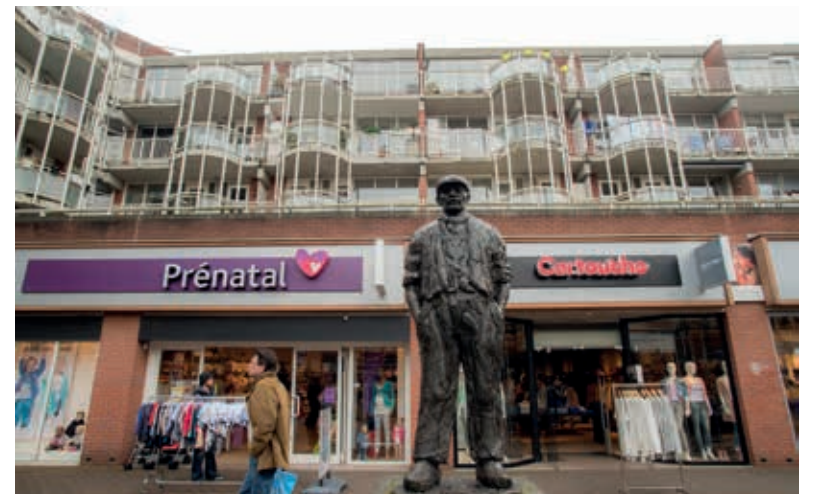
Het beeld De Polderjongen van Karel Gomes op het Polderplein in Hoofddorp.

InforMeer publiceert een serie over kunstwerken op pleinen, in parken en op andere plekken in Haarlemmermeer. Meer weten over een beeld in de buurt? Wie een e-mail stuurt aan nieuws@haarlemmermeer.nl heeft kans dat hij binnenkort over zijn favoriete beeld kan lezen.