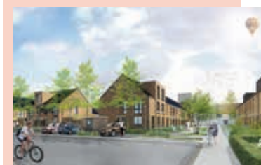
Impressie uit het voorlopig ontwerp van de nieuwe buurt, gezien vanaf Giessenburg in de richting van Assumburg.

Naast Het Spectrum aan Assumburg in Hoofddorp worden nieuwe woningen gebouwd. Novaform is door de gemeente aangewezen als ontwikkelaar op basis van hun voorlopig ontwerp, de inpassing van het groen, het parkeren, de voorgestelde verkeerscirculatie en de aansluiting van de sporthal op de nieuwe buurt. Op dinsdag 28 februari is er van 17.00 tot 20.00 uur een inloophbijeenkomst in Het Spectrum. Tijdens de bijeenkomst zijn het voorlopig ontwerp en het bouwplan in te zien. Verder wordt informatie gegeven over het plan voor de renovatie van de sporthal van Het Spectrum en het nieuwe bestemmingsplan. Naar verwachting neemt de gemeenteraad nog voor de zomer een besluit over de renovatie van de sporthal. Het opknappen begint op zijn vroegst in april 2018, de woningbouw start naar verwachting in het derde kwartaal van 2018. Zie ook haarlemmermeer.nl/spectrum.