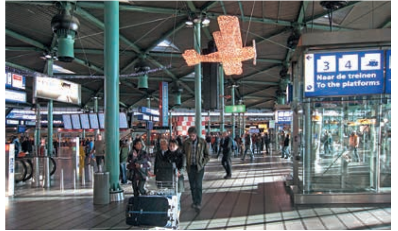
Op luchthaven Schiphol kunnen inwoners van Haarlemmermeer stemmen tijdens de Tweede Kamerverkiezingen op 15 maart.

Alle stemgerechtigden in Haarlemmermeer die geen stempas hebben ontvangen of deze kwijt zijn, kunnen via de gemeente een nieuwe pas aanvragen. De oude stempas wordt ongeldig gemaakt en opgenomen in een register. Als de stempas alsnog bezorgd of gevonden wordt, kan er met die stempas dus niet meer worden gestemd.