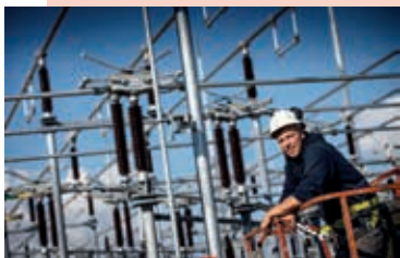
Een transformatorstation van TenneT.

Netbeheerders TenneT en Liander informeren inwoners tijdens een inloopbijeenkomst op dinsdag 28 februari tussen 18.00 en 21.00 uur in het raadhuis in Hoofddorp over de laatste stand van zaken rondom een nieuw transformatorstation aan de oostzijde van de A4 en bijbehorend kabeltracé tussen de stations Vijfhuizen en Nieuwe Meer en het nieuwe station. De afgelopen maanden hebben TenneT en Liander onderzoek gedaan naar een geschikte locatie voor het nieuwe transformatorstation en gekozen voor een perceel in PrimA4a bij Rijsenhout. De gemeente kan zich vinden in deze keuze als rekening wordt gehouden met een aantal zaken. Meer informatie: tennet.eu/a4zone .