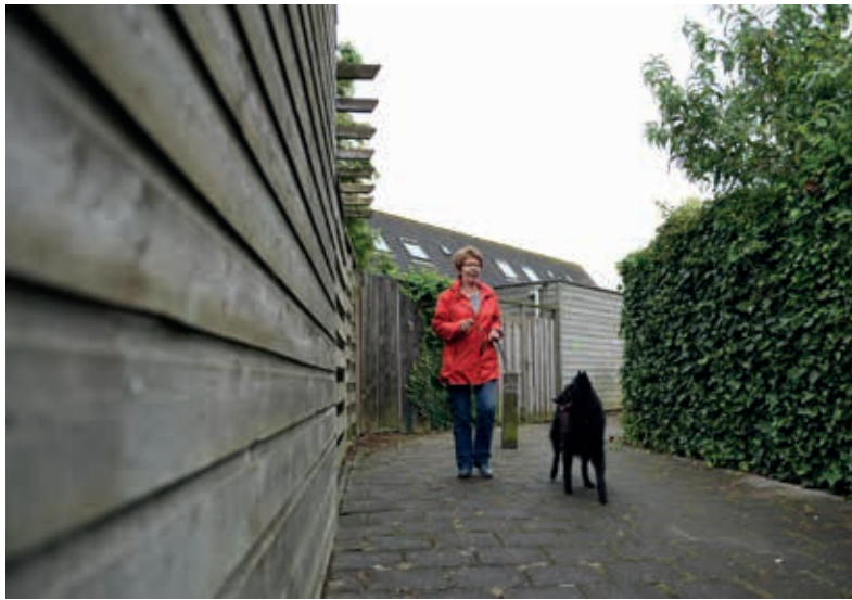
Hondeneigenaren helpen tegen woninginbraken door verdachte situaties te signaleren en melden.

Het aantal overlastmeldingen over verwarde personen was vorig jaar even hoog als in 2015 (420). Hiervoor is een ‘Plan van aanpak zorg voor personen met verward gedrag’ gemaakt dat in 2017 wordt uitgevoerd. Het aantal meldingen van jeugdoverlast nam af (-284), evenals het aantal vernielingen (-196) en diefstallen uit auto's (-18). Er werden vorig jaar 148 minder fietsen gestolen dan in 2015. Opvallend is een toename van autodiefstal (+22) en van diefstal van bromfietsen/scooters (+27). In 2016 waren er meer burenruzies (+14) en 19 gevallen van drugsoverlast meer dan in 2015.