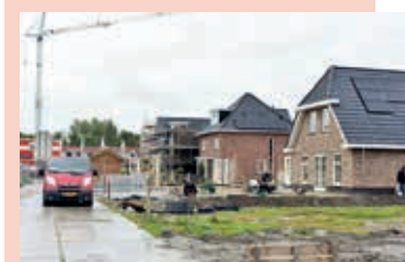
In Nassaupark wordt al druk gebouwd.

Wie een woning zoekt in Haarlemmermeer kan op zaterdag 12 november van 13.00 tot 16.00 uur terecht op de jaarlijkse Woningmarkt Haarlemmermeer in de Passage van het Cultuurgebouw, Raadhuisplein 3-9 in Hoofddorp. Bezoekers kunnen zich bij de stands op de woningmarkt uitgebreid oriënteren op de mogelijkheden van huren of kopen van zowel bestaande woningen als huizen in toekomstige bouwprojecten. Ook zijn er korte presentaties van onder meer woningcorporatie Ymere, ontwikkelaar AM, Rabobank Regio Schiphol en de gemeente. Toegang is gratis. Woningmarkt-haarlemmermeer.nl.