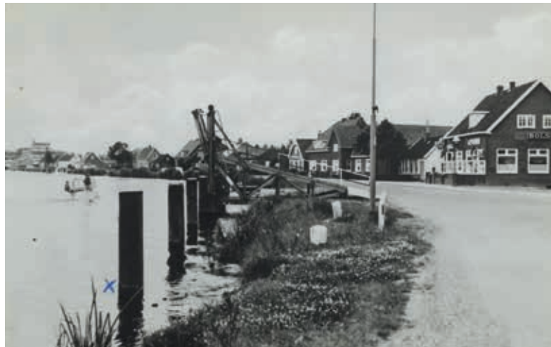
De Ringdijk bij Burgerveen met rechts de oprit naar de Venneperweg in 1967.

De gemeente is op zoek naar verhalen over de Ringvaart. Elke herinnering aan de Ringvaart en Ringdijk in Burgerveen of elders is welkom. Verhalen, foto's of filmpjes delen kan via verhalen@haarlemmermeer.nl, 0900 1852 of op facebook.com/gemeentehaarlemmermeer.