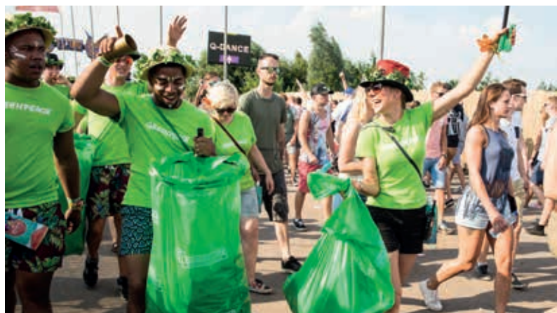
De gemeente is een partnerschap aangegaan met ID&T, organisator van Mysteryland, dat het hoogste predicaat voor duurzaamheid heeft behaald. Op de foto leden van de Green Teams die het festivalterrein dansend schoonhielden. De organisatie zorgde ervoor dat alle afval gescheiden werd afgevoerd.