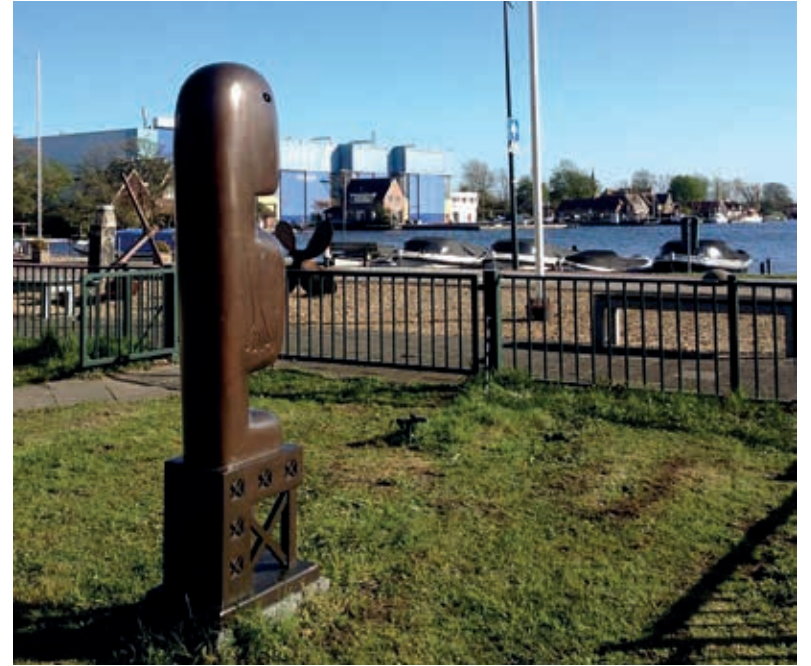
'Monsieur Hulot' kijkt vanaf zijn plek in het parkje aan de Huigsloterdijk uit over het water van de Kaag en het Kaageiland.

op het filmische personage met pijp en hoedje, maar hij staat op een soort vierkant flatgebouw, dat als sokkel dient. Hij gebruikt die moderniteit als opstapje om van de tijdloosheid van het uitzicht te genieten. "Het is een knuffelbaar mannetje", vindt Van den Berk. "Inmiddels is het een beeld van iedereen geworden." Wethouder Cultuur Derk Reneman: "In Haarlemmermeer investeren we flink in kunstwerken in de openbare ruimte zodat iedereen deze kunstwerken kan bekijken en ervan kan genieten. Ze moeten deel worden van het dagelijks leven, maar mogen nooit alledaags worden."