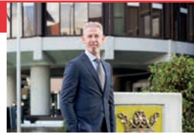
Burgemeester Onno Hoes.

andere de politie, de Belastingdienst, het Openbaar Ministerie en de Omgevingsdienst deur voor deur de bedrijven te bezoeken en controleren. Dat leverde bij de eerste controles, eind 2016 en in 2017 het nodige op: hard drugs, illegale auto's en hennepkwekerijen. De controles hebben resultaat: die van deze week leverde aanzienlijk minder op aan illegale en criminele praktijken. En dat betekent dat de goede bedrijven zich gesteund voelen in hun strijd tegen soms vreemde, wat lugubere, burens. Een aantal ondernemers wil stevig in het bedrijventerrein investeren en ook de gemeente heeft flink in de infrastructuur geïnvesteerd. Kortom, als we samen deur voor deur de criminaliteit en verloedering aanpakken, dan roepen we de criminaliteit die onze samenleving ondermijnt een stevige halt toe. En dan kunnen we op een dag zeggen: 'Wauw! Dat lijkt net bedrijventerrein De Weeren 20|20!'"