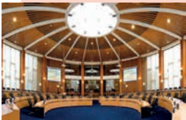
De raadzaal van de gemeente Haarlemmermeer.

Op 21 november zijn er in Haarlemmermeer en in Haarlemmerliede en Spaarnwoude gemeenteraadsverkiezingen voor de nieuwe, samengevoegde gemeente. Lokale politieke partijen die willen deelnemen, moeten zich vóór 27 augustus 2018 (opnieuw) laten registreren. Dat geldt voor nieuwe lokale partijen, maar ook voor lokale partijen die bij de vorige gemeenteraadsverkiezing hebben meegedaan. Landelijke politieke partijen die hebben meegedaan met de verkiezing van de Tweede Kamer of Provinciale Staten hoeven zich niet opnieuw te laten registreren. Meer informatie via verkiezingen@haarlemmermeer.nl of via 0900 1852 (vragen naar team Verkiezingen).