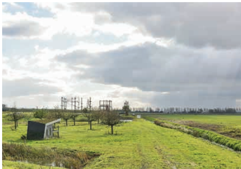
Bij de aanleg van PARK21 wordt grond gebruikt die afkomstig is van buiten het gebied.

HAARLEMMERMEER – Wie wil weten hoe het precies zit met het hergebruik van grond en bagger op Schiphol Trade Park en in PARK21 kan naar de informatiebijeenkomst op dinsdag 3 juli van 19.00-20.30 uur in het Trefpunt, Hoofdweg 1318 in Nieuw-Vennep.